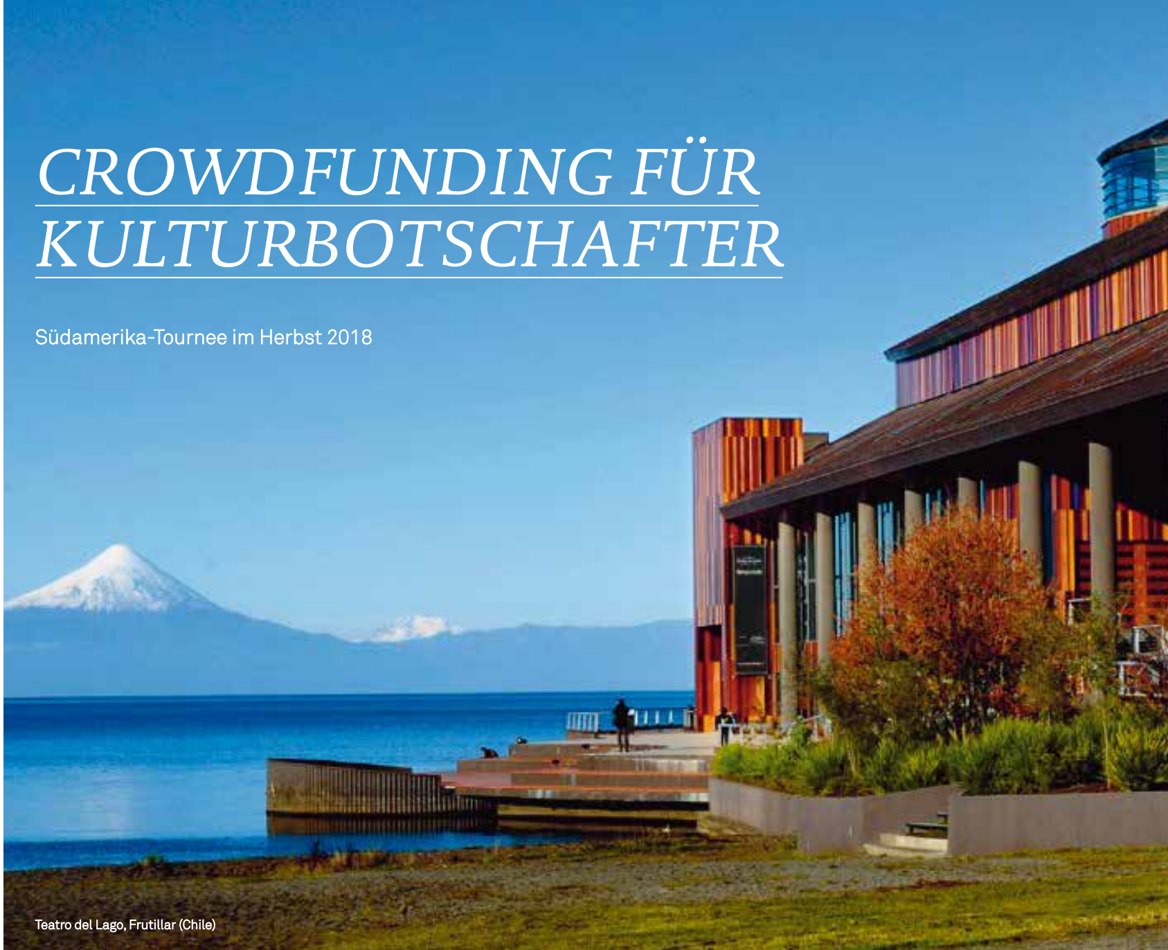
Teatro del Lago, Frutillar (Chile)

— Im Herbst 2018 heißt es Überseekoffer packen und einchecken: Nach Vorproben in Frankfurt am Main geht die Junge Deutsche Philharmonie gemeinsam mit ihrem Ersten Dirigenten und Künstlerischen Berater Jonathan Nott Anfang September auf Südamerika-Tournee. Die Reise führt dabei zunächst nach Frutillar, Chile. Dort finden neben den Endproben für das Tourneeprogramm und einem Abendkonzert auch ein umfangreiches Education-Projekt mit Kindern und Jugendlichen aus der Region sowie ein Schulkonzert statt. Im Anschluss an den Aufenthalt in Frutillar sind weitere Konzerte in Brasilien, Kolumbien und Peru geplant.